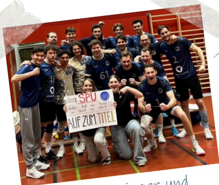
Herren 1: Cupsieger und Vizemeister 2024/25!

Wir wünschen allen unseren Teams für die kommende Saison viel Erfolg und vor allem immer viel Freude beim Volleyball mit der Sportunion Favoriten!