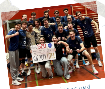
Herren 1: Cupsieger und Vizemeister 2024/25!

Wir wünschen allen unseren Teams für die kommende Saison viel Erfolg und vor allem immer viel Freude beim Volleyball mit der Sportunion Favoriten!